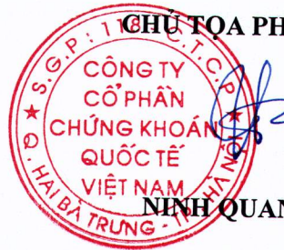
NINH QUANG HẢI